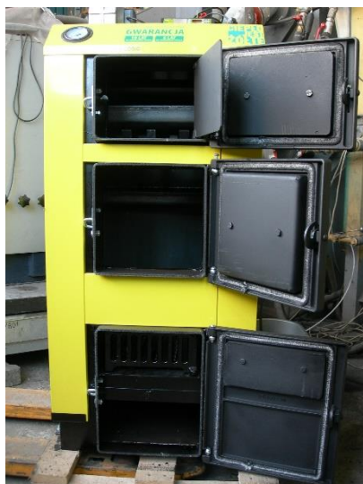
Rys. 1. Widok kotła c.o. typu KSW PLUS o mocy 20 kW

Kocioł c.o KSW PLUS o mocy 20 kW z ręcznym zasypem paliwa (rys. 1) jest przedstawicielem typoszeregu niskotemperaturowych, stalowych kotłów wodnych, przeznaczonych do układów otwartych, przystosowanych do spalania węgla kamiennego sortyment orzech, sortyment groszek oraz drewna kawałkowego. W jednostkach tych paliwo zasypywane jest do komory załadowniczej na ruszt wodny. Komora załadownicza jest zamknięta drzwiczkami zasypowymi. Na drzwiczkach zasypowych umieszczona jest przepustnica powietrza wtórnego. Nad drzwiczkami zasypowymi znajdują się drzwiczki wyczystne umożliwiające dostęp do wymiennika. Pod ruszt podawany jest strumień powietrza pierwotnego, za pomocą wentylatora nadmuchowego, umieszczonego na górnej części kotła. Spaliny po przejściu przez wymiennik ciepła spaliny-woda, przechodzą przez czopuch kotła do komina. Regulacja wydajności cieplnej kotła realizowana jest przez elektroniczny sterownik. Sterownik ten steruje pracą wentylatora powietrza i pompą obiegową c.o. dążąc do utrzymania zadanej temperatury wody wychodzącej z kotła. Jednostka wyposażona jest również w mechaniczny przegarniacz rusztu. Kocioł izolowany jest wełną mineralną osłoniętą blachą stalową.