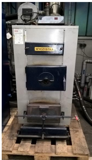
Rys. 2. Widok kotła c.o. typu GENERATOR o mocy 35 kW

dostarczane jest wentylatorem poprzez dysze umieszczone na różnych wysokościach komory spalania. Regulacja wydajności cieplnej kotła realizowana jest przez elektroniczny sterownik temperatury. Sterownik ten steruje pracą wentylatora powietrza i pompą obiegową c.o.