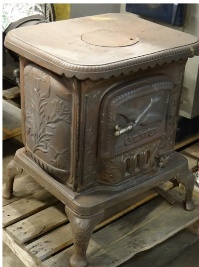
Rys. 5. Widok pieca typu „KOZA”

Piec typu „KOZA” z ręcznym zasypem paliwa (rys. 5) jest przystosowany do spalania drewna i węgla kamiennego sortyment orzech. W jednostkach tych paliwo zasypywane jest do komory załadowniczej na ruszt. Komora załadownicza jest zamknięta drzwiczkami zasypowymi. Pod drzwiczkami umieszczona jest przepustnica powietrza pierwotnego.