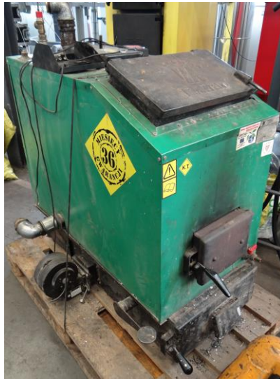
Rys. 3. Widok kotła c.o. typu MODERATOR o mocy 25 kW

Kocioł c.o. SKI o mocy 17,5 kW z ręcznym zasypem paliwa (rys. 4) jest przedstawicielem typoszeregu niskotemperaturowych, stalowych kotłów wodnych, przeznaczonych do układów otwartych, przystosowanych do spalania koksu i węgla kamiennego sortyment orzech. W jednostkach tych paliwo zasypywane jest do komory załadowniczej na ruszt wodny. Komora załadownicza jest zamknięta drzwiczkami zasypowymi. Na drzwiczkach popielnikowych umieszczona jest przepustnica powietrza pierwotnego regulowana za pomocą miarkownika ciągu w zależności od zadanej temperatury wody zasilającej układ c.o. W drzwiczkach zasypowych umieszczona jest przepustnica powietrza wtórnego. Spaliny po przejściu przez wymiennik ciepła spaliny-woda, przechodzą przez czopuch kotła do komina. Regulacja wydajności cieplnej kotła realizowana jest przez miarkownik ciągu. Kocioł izolowany jest wełną mineralną osłoniętą blachą stalową.