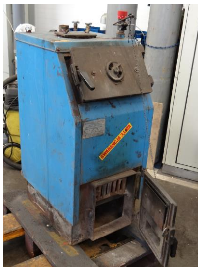
Rys. 4. Widok kotła c.o. typu SKI o mocy 17,5 kW

Kocioł c.o. SKI o mocy 17,5 kW z ręcznym zasypem paliwa (rys. 4) jest przedstawicielem typoszeregu niskotemperaturowych, stalowych kotłów wodnych, przeznaczonych do układów otwartych, przystosowanych do spalania koksu i węgla kamiennego sortyment orzech. W jednostkach tych paliwo zasypywane jest do komory załadowniczej na ruszt wodny. Komora załadownicza jest zamknięta drzwiczkami zasypowymi. Na drzwiczkach popielnikowych umieszczona jest przepustnica powietrza pierwotnego regulowana za pomocą miarkownika ciągu w zależności od zadanej temperatury wody zasilającej układ c.o. W drzwiczkach zasypowych umieszczona jest przepustnica powietrza wtórnego. Spaliny po przejściu przez wymiennik ciepła spaliny-woda, przechodzą przez czopuch kotła do komina. Regulacja wydajności cieplnej kotła realizowana jest przez miarkownik ciągu. Kocioł izolowany jest wełną mineralną osłoniętą blachą stalową.